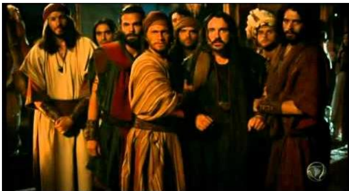
El gran valor de la Familia natural: En el encuentro de José con sus hermanos en Egipto hubo sorpresa, espanto y sobre todo temor "Yo soy José. ¿Vive aún mi padre? Sus hermanos no pudieron responderle, porque estaban turbados delante de él" (Gn.45:3b)

- Y a los papás también se les exhorta: "Y vosotros, padres, no provoquéis a ira a vuestros hijos, sino criadlos en disciplina y amonestación del Señor" (Ef.6:4).