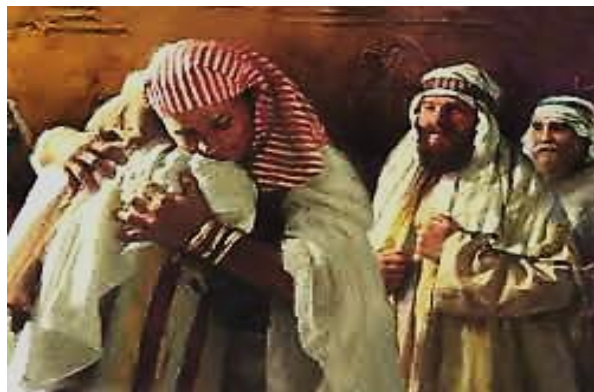
"Yo soy José, vuestro hermano, el que vendisteis a los egipcios. Ahora, pues, no os entristezcáis ni os pese haberme vendido acá, porque para salvar vidas me envió Dios delante de vosotros" (Gn.45:4b-5)