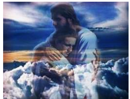
Tal como Dios también nos comprende y asiste