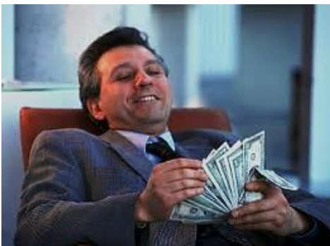
El amor al prójimo implica el ser solidarios

"Vosotros, hermanos, a libertad fuisteis llamados; solamente que no uséis la libertad como ocasión para la carne, sino servíos por AMOR los unos a los otros, porque TODA la LEY en esta sola PALABRA se CUMPLE: "AMARÁS A TU PRÓJIMO COMO A TI MISMO". Pero si os mordéis y os devoráis unos a otros, mirad que también no os destruyáis unos a otros. Digo, pues: Andad en el Espíritu, y no satisfagáis los deseos de la carne, porque el deseo de la carne es contra el Espíritu y el del Espíritu es contra la carne; y estos se oponen entre sí, para que no hagáis lo que quisierais" . (Gl.5:13-17)