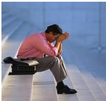
No ser indiferentes al dolor ajeno