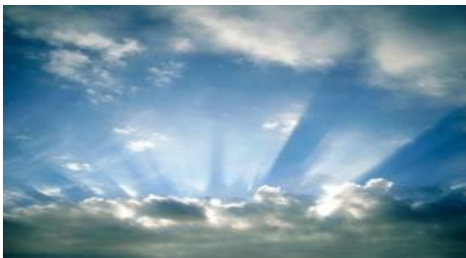
El PRIMER Cielo o Atmósfera terrestre