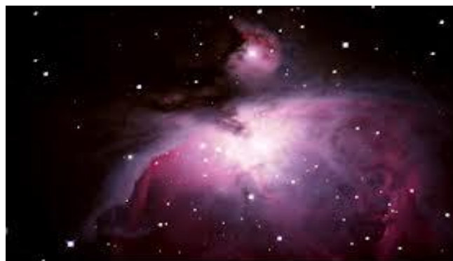
El TERCER CIELO NATURAL, el Universo o Espacio Sideral, el Cosmos