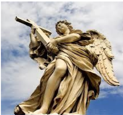
No se les venera, ni se les invoca u ora. Se pide al Padre en el Nombre de Jesús por su protección, que es muy efectiva

"Que nadie os prive de vuestro premio haciendo alarde de humildad y de dar CULTO a los ÁNGELES (metiéndose en lo que no ha visto), hinchado de vanidad por su propia mente carnal, pero no unido a la Cabeza, en virtud de quien todo el cuerpo, nutriéndose y uniéndose por coyunturas y ligamentos, crece con el Crecimiento que da Dios". (Col.2:18-19)