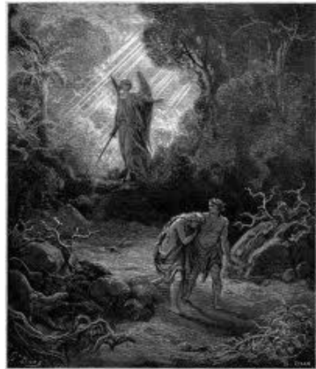
Querubines guardaron el Edén del hombre

Alaban a Dios sin descanso DÍA y NOCHE. Dan GLORIA, HONOR y ACCIÓN de GRACIAS (Ap.4:8)