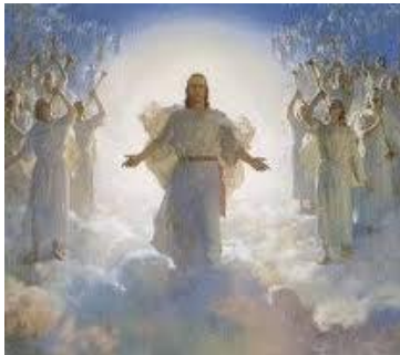
"Galileos, ¿Por qué estáis mirando al Cielo? Este mismo Jesús, que ha sido tomado de vosotros al Cielo, así vendrá como lo habéis visto ir al Cielo?" (Hch.1:11)

Jesús descendió del CIELO (Jn.3:13) y volvió a subir a ellos "Por ENCIMA de TODOS los CIELOS" (Ef.4:10; Hch. 1:11), de allí VOLVERÁ A VENIR (Mt.24:30; 1Ts. 4:16).