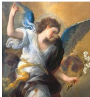
El Arcangel GABRIEL , Mensajero celestial

Pues todo tipo de PODER en el CIELO y en la tierra le ha sido sometido: