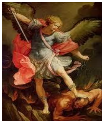
El poderoso Arcangel MIGUEL Comandante de los Ejércitos Celestiales

En Hch.8:10 , un ÁNGEL trató con Felipe; en Hch.10:3ss . Otro ÁNGEL visitó a Cornelio el Centurión romano; y en Hch.27:23 un ÁNGEL visitó a Pablo y lo consoló en la adversidad de su viaje por la tormenta que durante varios días los asoló para dar finalmente en la isla de Malta.