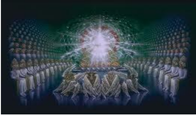
"Alrededor del trono había veinticuatro tronos, y en los tronos vi sentados a VEINTICUATRO ANCIANOS vestidos de ROPAS BLANCAS, con CORONAS de ORO en sus cabezas" (Ap.4:4)

Primer rango celestial. Son 24. Tienen TRONOS –señal de co-Gobierno- alrededor del TRONO DE DIOS. Apariencia humana (ANCIANOS). Usan vestiduras blancas -las obras justas de los SANTOS- y llevan CORONAS en sus cabezas – señal de Autoridad-.