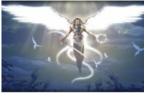
Los DOMINIOS, Gobernadores o Kosmokrator son los "Hombres fuertes" y tratan con las personas

Asimismo, son de seguro las AUTORIDADES ANGÉLICAS que van delante de aquellos siervos de Dios responsables del MINISTERIO QUINTUPLE de la IGLESIA de CRISTO (Gn.24:7; Éx.23:20 y otros).