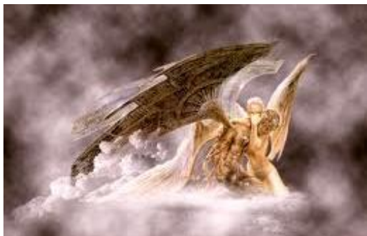
Los PRINCIPADOS o Arcángeles son ángeles superiores

cuerpo de Moisés ( Jud.9 ) y venció. Miguel, además tiene una función especial como ÁNGEL GUARDIÁN del pueblo de Dios ( Dn.10:21,12:1 )