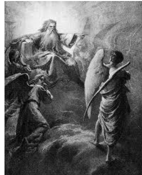
I Rebelión angélica: Luzbel y sus ángeles son expulsados del 3er. Cielo

"Otra señal apareció en el Cielo, un gran dragón escar lata... Su cola arrastró la tercera parte de las estrellas del Cielo y las arrojó sobre la Tierra". (Ap.12:3-4)