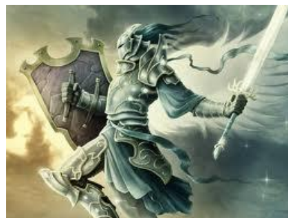
Las POTESTADES o Exousia dominan grandes poblaciones

O también forman parte del ejército de las tinieblas ( Ef. 6:12 ), como TERCER GRADO ANGÉLICO en la JERARQUÍA de AUTORIDAD SATÁNICA .