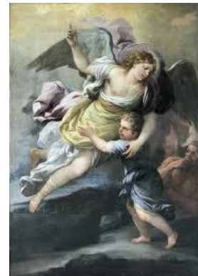
Ángel de la Guarda o Custodio

El Señor Jesús recibió la asistencia ANGÉLICA personal en varias ocasiones durante su ministerio público (Mt.4:11; Lc.22:43) y si lo hubiera deseado podría haber dispuesto de tener bajo sus órdenes a miles de ÁNGELES en Getsemaní o en cualquier otra parte si quería desviarse de la senda del sacrificio que el Padre le había señalado (Mt.26:53)