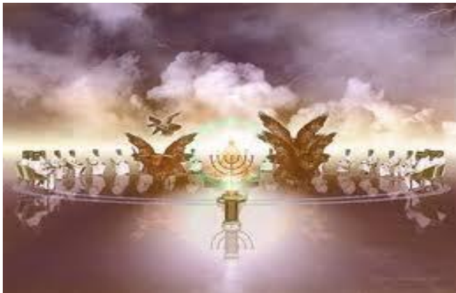
El Trono de Dios, el E.S., los 4 Querubines y los 24 Ancianos en el TERCER CIELO sobrenatural

"En el principio creó Dios los CIELOS y la Tierra. La Tierra estaba desordenada y vacía, las tinieblas estaban sobre la faz del abismo y el Espíritu de Dios se movía sobre la faz de las aguas.