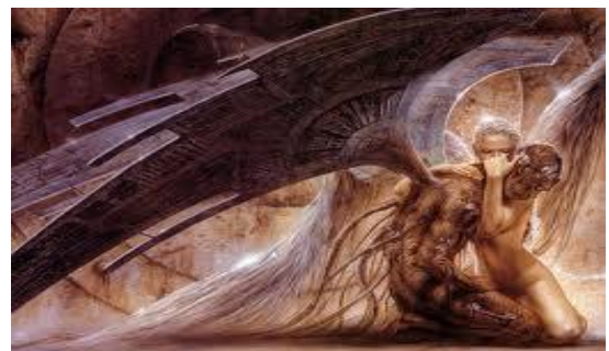
Ángeles Caídos por su II Rebelión a Dios, al copular con mujeres de la Tierra en relaciones contra natura, igual que los de Sodoma que pretendieron hacerlo con ángeles (2Pe.2:4; Jud.6-7)

"Quien habiendo subido al Cielo está a la Diestra de Dios; y a Él están sujetos ÁNGELES, autoridades y poderes". (1Pe.3:22)