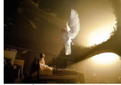
Los ÁNGELES están al servicio personal de los creyentes

Tampoco resulta incongruente verlos relacionado con el JUICIO FINAL (Mt.16:27; Mr.8:38,13:27; Lc.12:8; 2Ts.1:7, etc.).