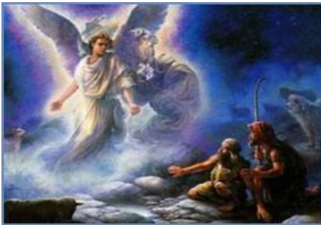
Medida de Hombre, medida de Ángel (Ap.21:17)

Pero en el caso excepcional de los QUERUBINES , la descripción que nos hacen Ezequiel y Juan difiere mucho de la humana.