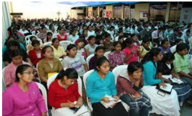
Ministración de cultos legalistas con hombres y mujeres separados, ¿Cómo en la Sinagogas judías? (i?)

guardan Sábados o se privan en el comer, en el beber y señalan como sectas a quienes tienen ciertas formas de Alabar, de danzar, de Adorar y de orar en otras congregaciones; pero ellos en cambio, imponen modas, maneras de ubicarse en los Templos, Ayunos sistematizados con horarios pre-establecidos; formas obligatorias de Ofrendar y hasta de "Diezmar" (i?); demandando restricciones y prohibiciones para la ministración de Bautismos en el Espíritu y Agua, en los Matrimonios, en las Cenas del Señor, en los Lavatorios de pies; y otros hasta caen en Fetichismo, al dar valor sagrado a objetos: maderas, rosas, cruces, tierras, velos, a árboles y a sus hojas, etc. ¿Quién los entiende?