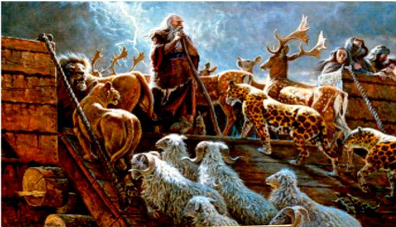
Tan distinta es cada Dispensación de la siguiente, que recién hasta después del Diluvio, el hombre y las fieras de la tierra devoraron carne. En el efecto Invernadero, solo ingerían vegetales (Gn.1:30)

"Así fue destruido todo ser que vivía sobre la faz de la Tierra, desde el hombre hasta la bestia, los reptiles y las aves del cielo; fueron borrados de la Tierra. Solamente quedó Noé y los que con él estaban en el Arca. Y permanecieron las aguas ciento cincuenta días sobre la Tierra" (Gn.7:23-26)