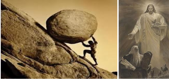
Cumplir la Ley, era una carga demasiado pesada para el hombre, por eso Dios nos envió su Gracia, una carga más ligera y liviana. Dios Espíritu Santo por eso está ayudándonos individualmente

- De manera similar, Dios, en su naciente pueblo, hizo prácticamente lo mismo, mediante la LEY: Aunque ellos no lo comprendieran; en los propósitos de Dios estaba el que aprendieran a ejercitarse en OBEDIENCIA... ¡Hemos sido hechos a la imagen y semejanza de Dios! (Gn.1:27).