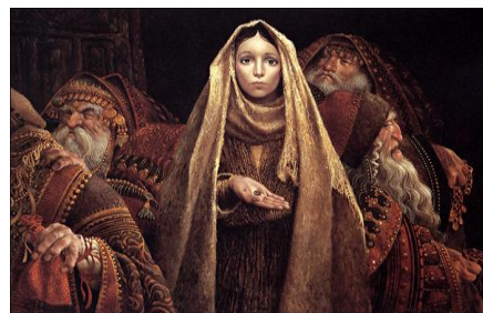
La viuda salió más justificada ante Dios, porque al dar su óbolo al Templo, no lo hizo de lo que le sobraba como hacían los demás, sino dio el total de lo único que tenía para vivir (i)

- Quienes, HOY, por su ignorancia y con toda su buena voluntad –y también otros con gran interés de por medio– exigen por ejemplo el DIEZMO en sus congregaciones, lamentablemente, ¡SE QUEDARON EN EL SINAI! Están iguales que los Gálatas que deseaban asimilar la Circuncisión. La Provención de Dios no cuenta, las cuentas bancarias o los ingresos de los hermanos sí... (i?). Cristo, N.S. en vano murió en la Cruz: la Salvación de los problemas y del alma, ya no es por Gracia, ¿Acaso sigue siendo por LAS OBRAS DE LA LEY? (i).