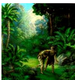
Adán y Eva en el Edén, finalmente fueron expulsados