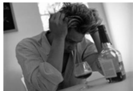
Dios condena todo exceso: la Borrachera (1Co.6:10)

Tampoco debe PROHIBIRSE BEBER LICOR. Dios condena todo exceso: la Borrachera; pero NO EXIGE que nos PRIVEMOS de alguna bebida o licor para degustar: