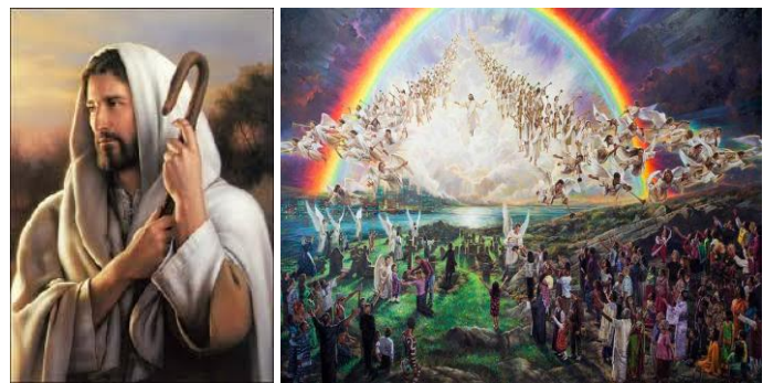
La Gracia llegó con N.S. Jesucristo y proseguirá en su Gobierno Universal en el Milenio y luego por la Eternidad

- Al último Día de la Gracia el Señor Jesús lo llamó el "Día final" o "El Día postrero" ( Jn.6:39,40,44y54 ). Aquí son cancelados los 6,000 años del gobierno humano sobre la Tierra -y el final también de los 42 meses autorizados al Anticristo-, para dar paso a la Consumación de la Gran IRA de Dios: el derramamiento de las 7 COPAS ( Ap.15 y 16 ) durante los inmediatos 30 días siguientes ( Dn.12: 11; Os.5:7 y 9-15 ).