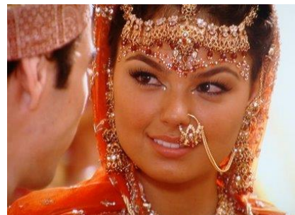
"...Puse joyas en tu nariz, zarcillos en tus orejas y una hermosa corona en tu cabeza" (Ez.6:12)

Tu fama se difundió entre las naciones a causa de tu bellísima belleza, que era perfecta POR EL ESPLENDOR QUE YO PUSE SOBRE TI, dice Jehová, el Señor". (Ez.16:6-14) SIN MÁS COMENTARIOS... (i)