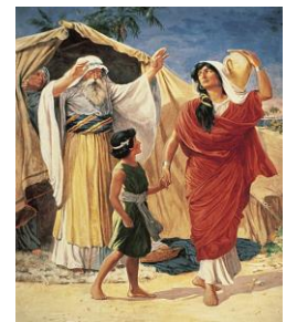
Abraham despide a Agar y a su hijo Ismael por orden de Dios

- Pero, existe una tentación muy grande en muchos creyentes que obnubilados por leer a Moisés al pie de la letra, es decir, al A.T.; pretenden retroceder en su FE y aspiran a querer practicar al pie de la letra "LAS OBRAS DE LA LEY" en la GRACIA sin darse cuenta que debemos obedecerlas, pero con el PERFECCIONAMIENTO que nos da el leerlas "CON LOS OJOS DE LA GRACIA" (Mt. 5, 6 y 7) Esto, es lo que actualmente le sucede al pueblo judío, le pasó también a los miembros de la Iglesia de Galicia, que intentaron agregar la Circuncisión a su fe, para según ellos, ser "mejores cristianos" y lo que le sigue pasando a todo creyente actual que trata de asimilar a su vida de Fe, LAS OBRAS DE LA LEY: