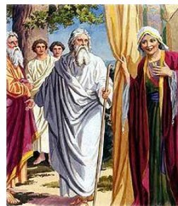
Abraham y Sara que rie al enterarse que iba a ser madre