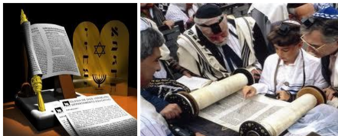
La Ley es para un infante o niño espiritual