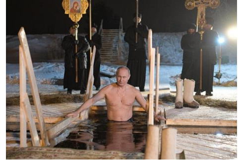
La pregunta es: ¿Bautizado o presentado ante Dios? Con Cristo tenemos que ser sepultados en las aguas del Bautismo y solidarizarnos con su muerte, para ser también RESUCITADOS al emerger de ellas por la fe en el Poder de Dios que lo levantó de entre los muertos. Es lo Bíblico (Ro.6:3-8; Col.2:12)