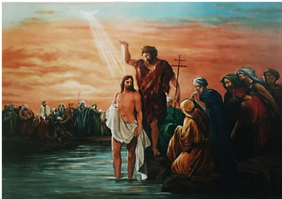
"Bautismo del S. Jesús": 2.90m. x 1.85 m. - Autor: Andrés Eyzaguirre Ramírez –Bautisterio Parroquia Sn. Juan Macías – Urb. "Túpac Amaru" - San Luis- LIMA/PERÚ