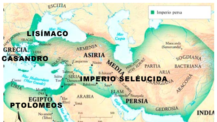
El Imperio Seléucida o Sirio, fue el más extenso