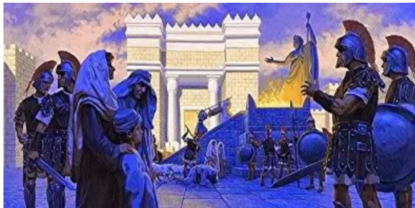
El 2do. Templo de Jerusalén donde Antíoco IV Epífanes, instaló la Abominación Desoladora: El Zeus Olímpico y el sacrificio de cerdos y con la pena de muerte al que no venerara las estatuas de Zeus colocadas en las calles

- Asimismo, hay un antecedente histórico, Antíoco IV Epífanes, el rey seléucida o sirio, que como un precursor del Anticristo entre el 167-164 a.C., instaló en el Sanctasanctorum, el Lugar Santísimo del TEMPLO de Jerusalén, la Abominación Desoladora ; saqueando el Templo, y colocando en el Lugar Santísimo, la estatua de Zeus o Júpiter -como lo llamaban los romanos-, y quemaron todos los libros sagrados. Se prohibió bajo pena de muerte la Circuncisión, rito de iniciación en los privilegios otorgados a la familia de Dios y señal de la Sagrada Alianza. Asimismo, se proscribió la Santificación del Sábado y la celebración de la Luna Nueva, costumbre ritual que remontaba a la época de los patriarcas. El sacrificio de cerdos -un acto que repugnaba más a los judíos-, se declaró obligatorio. Y como corolario de todas estas absurdas órdenes ofensivas, el terror de la persecución religiosa, se apoderó de Jerusalén y en toda Judea, al colocar en calles y plazas estatuas del dios Zeus para ser veneradas obligatoriamente por los transeúntes so pena de muerte si no lo hacían.