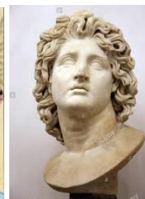
Busto de Alejandro