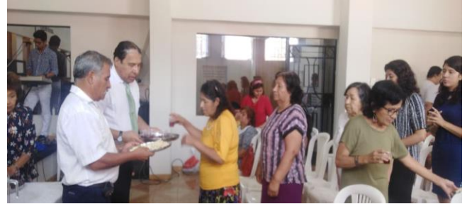
La Santa Cena: La Consagración del Cuerpo y la Sangre de Cristo y la "Partición del Pan" compartido con la membresía

3.- EL LAVATORIO DE PECADOS POR LA SANGRE DE CRISTO: En la Confesión de pecados mediante cualquiera de los procedimientos autorizados por la Palabra de Dios: