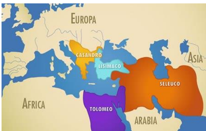
Así se repartieron los 4 Diádocos el Imperio de Alejandro

- La aparición o nacimiento de otros 4 cuernos notables, nos señalan un dominio y poder que ejercerán los nuevos monarcas sucesores en las cuatro direcciones dadas por los Vientos del CIELO, hacia los puntos cardinales: el Norte, el Sur, el Este y el Oeste.