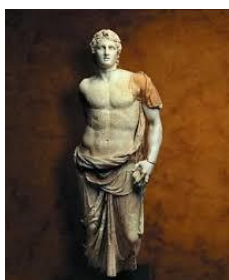
Estatua de Alejandro

- Un fuerte MACHO CABRÍO , llegando desde Europa -el poniente-, tan velozmente, que no asentaba siquiera sus pies sobre tierra. El Macho Cabrío, es el macho de la cabra, pero curiosamente en la Visión, es astado, con un cuerno enorme en su frente, entre sus ojos.