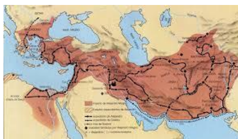
El vasto Imperio Internacional Griego de Alejandro