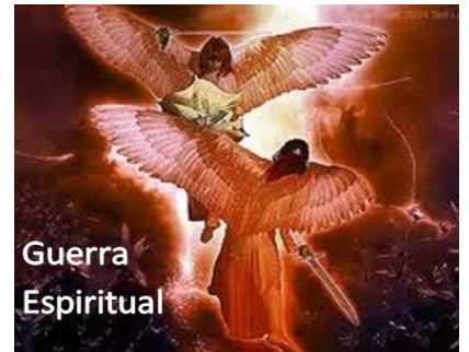
Cielo e Infierno combaten por la Salvación y la perdición eterna de los hombres