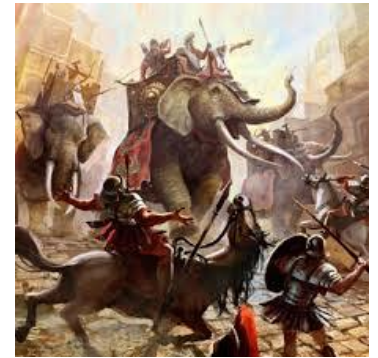
La poderosa fuerza militar seléucida

Vs.10: - "Pero los hijos de aquel se airarán y reunirán multitud de grandes ejércitos. Vendrá uno apresuradamente, inundará y pasará adelante; luego volverá y llevará la guerra hasta su fortaleza.