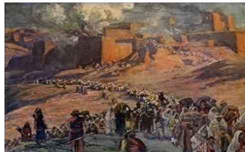
La salida del final de la deportación de Babilonia, les significó a los judíos varios años muy difíciles en su restablecimiento en Jerusalén

- El escriba y sacerdote Esdras hizo el mismo recorrido años después, con un grupo más pequeño de unas 1500 personas divididos en 12 familias -un número simbólico de las 12 tribu de Israel-, y demoró unos 4 meses ( Esd.7:1-28; 8:1-36 ).