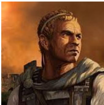
Antiochus IV Epiphanes

- Al no tener en cuenta la profunda fidelidad de los judíos al verdadero y único Dios, enseguida se planteó un conflicto a causa de su fe. Este príncipe del Pacto, debe ser el Sumo sacerdote Onías III.