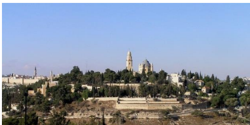
El Monte Sión

- A finales del periodo romano, se construyó una Sinagoga en la entrada de la estructura conocida como la Tumba de David, probablemente por que David trajo aquí el Arca de la Alianza desde Beit Shemesh y Quiriat-Jearim antes de la construcción del I Templo.