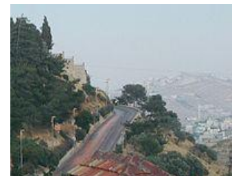
Vía automotriz de subida