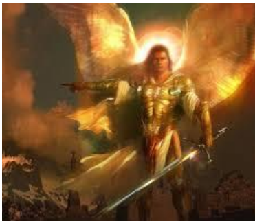
El Arcángel Miguel, jefe de los ejércitos Celestiales

El Señor Jesús y sus ángeles desde siempre, han estado defendiendo al hombre de los permanentes ataques satánicos. Miguel es el Principado o Arcángel de Dios -uno de los Siete ángeles de la Presencia-, encargado de los ejércitos celestiales y el principal defensor del pueblo de Dios.