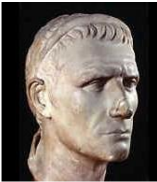
Antíoco III El Grande

- Ptolomeo V, Epifanes (204-180 a.C.), fue quien sufrió la reconquista de Palestina, el sitio y la toma de Gaza por las fuerzas seléucidas de Antíoco III, El Grande.