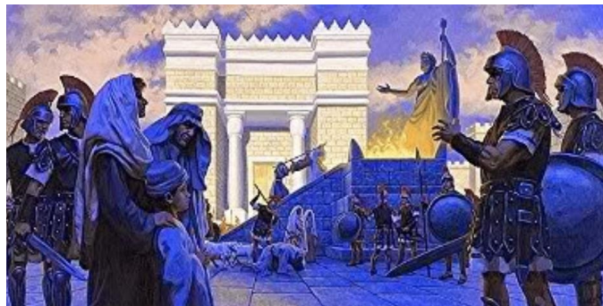
Como un precursor del futuro Anticristo, instaló la Abominación Desoladora en el Templo de Jerusalén