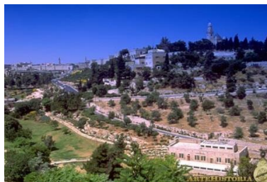
Ladera del Monte de Sión