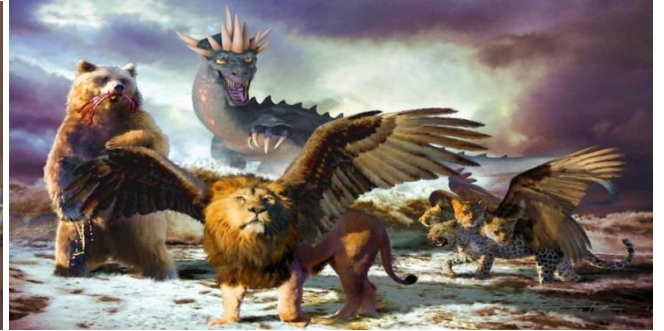
El Señor Jesús ha enfrentado siempre a estos principados