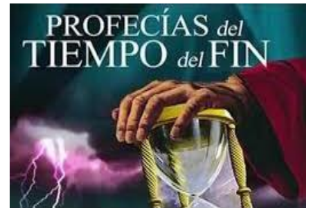
El rey del norte destruirá en sus propios territorios al rey del sur y los demás países musulmanes y árabes, tanto del nor-oeste africano como del Medio Oriente, los del Asia Menor

Vs.41: - "Entrará en la tierra gloriosa, y muchas provincias caerán; pero escaparán de sus manos Edom, Moab y la mayoría de los hijos de Amón".