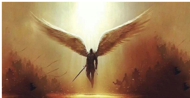
Los principados satánicos de los Imperios Internacionales Caldeo-Asirios, Medo-Persas y Griego