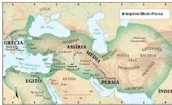
Imperio Seléucida con Antíoco III