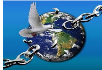
El E.S. es nuestro Ayudador, hay que pedirle que mate las obras de nuestra carne (Ro.8:13) para poder ser libres

2).- Al LIBERAR, nunca olvidemos que tratamos con demonios, que son seres muy inteligentes. Ellos tratarán de convencernos que no podemos echarlos fuera... ¡PERO LA AUTORIDAD ES LA DEL NOMBRE DEL SEÑOR JESUS, Y ESO, ES LO QUE VERDADERAMENTE FUNCIONA!