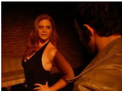
Los súcubos son una acción demoniaca que vinculan sexualmente a hombres