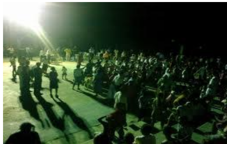
La Alabanza, la Adoración y la Palabra ministradas en una congregación muchas veces son poderosas para invitar a ser Liberados