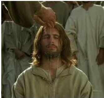
Antes del Bautismo de Agua es muy Importante Confesión de pecados ante una autoridad para ser Liberados

7).- Hay personas que no están dispuestas a ser Liberadas. Se sienten cómodas con su demonio dentro. Se entretienen "mutuamente", son "socios". Si existe influencia demoníaca, es fácil determinarla por la persistencia o asiduidad con que se realiza algo o se repite a menudo, siempre con lo mismo. Por eso la Palabra de Dios nos insta a no ceder a los deseos carnales, pues son "puertas abiertas" a la actividad demoníaca