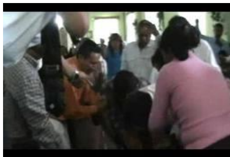
Posesión Demoníaca y Liberación en el Nombre de N.S. Jesucristo