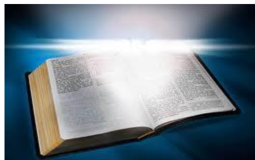
"Toda la Escritura es inspirada por Dios y útil para enseñar, redargüir, corregir y para instruir en justicia": 2Ti.3:16-17