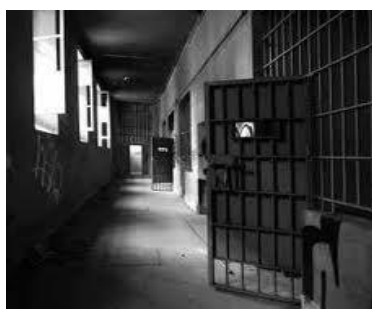
Liberación significa abrir nuestras Cárceles para escapar a la libertad gloriosa de los Hijos de Dios

- Cuando perciben que espiritualmente no hay un creyente con AUTORIDAD que los pueda echar fuera, interfieren la ministración de los Dones, interrumpiendo actividades, oraciones de intercesión, cultos de células y cultos centrales. Se burlan en las reuniones de los hermanos, y empiezan a tomarles el pelo con revelaciones y falsas profecías.