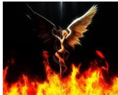
Ángeles celestiales y demonios propician incubos y súcubos