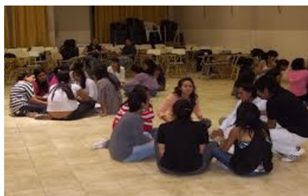
Liberarnos es confesar nuestros pecados. Esta fesión puede ser personal, grupal o con algún hno.(a) o ministro autorizado.

- El que exista manifestaciones externas o no, NO SON SEÑAL OBLIGADA DE QUE UNA PERSONA HAYA SIDO LIBERADA . Debemos tener certeza de su LIBERACION porque creemos en el Nombre del S. JESUS y no por ningún es-pectáculo que demos, por más estridente o apacible que este sea. Es un asunto de FE y de Aceptación.