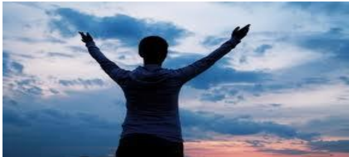
"Ninguna condenación hay para los que están en Cristo Jesús, los que no andan conforme a la carne, sino conforme al Espíritu" (Ro.8:1)