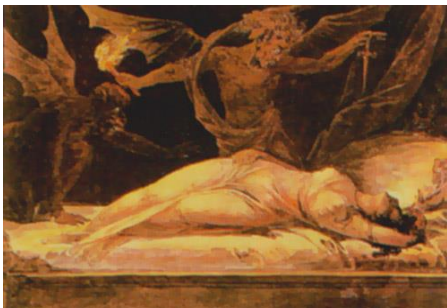
Los incubus, relacionan intimidad sexual de demonios con mujeres

Hay también, quiénes mantienen relaciones ilegítimas y secretas con personas del sexo opuesto o lo que es peor, vínculos homosexuales o prácticas de aberraciones sexuales ocultas: Satanismo, sadomasoquismo, bestialismo o zoofilia, necrofilia, etc; si de por medio están demonios por prácticas frecuentes, la persona debe tomar la decisión de NO CEDER MAS a esos DESEOS CARNALES, una vez que estos hayan sido expulsados. Tarea delicada y muy esforzada de cada creyente y del Espíritu Santo (Ro.8:13), ...si se lo permitimos (i).