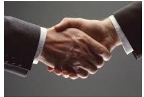
Desde un apretón de manos se distingue al que es deshonesto e hipócrita

Comprométase a NO ROBAR ni lo más mínimo de su patrón, del gobierno ni de ninguna otra persona. Haga un Voto hoy mismo a andar en INTEGRIDAD delante del SEÑOR y tome una ACTITUD VALIENTE y MILITANTE frente a pecados como el del SOBORNO, las COIMAS, la PIRATERÍA, la ESTAFA, las MEDIAS VERDADES y la INMORALIDAD. El pueblo de Dios tiene que ser HONESTO aún en las cosas más simples.