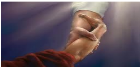
Al ministrar sobre Finanzas en la Iglesia entendemos mejor el Propósito de Dios al incluirlas abundantemente en su Palabra

Y ya hemos visto también que por desconocimiento de esta VERDAD de Dios y su auténtica REVELACIÓN, equivocadamente, algunas autoridades de su pueblo, -por no decir la gran mayoría-, a diferencia de lo que Dios mismo nos ha ministrado tienen en muy poco el enseñar lo relacionado al manejo de las FINANZAS en la VIDA DE FE . En ellas también se cumple, que “Algunos rinden 30, otros 60 y otros como 100 por uno” (Mc.4:20).