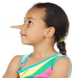
Los niños son mentirosos de por sí "Instruye al niño en su camino y ni aún de Viejo, se apartará de él". (Pr.22:6)