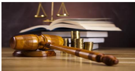
La Palabra de Dios es la que Dirime

Las disputas por dinero con los demás no deberían ser DETERMINANTES en las vidas de los creyentes: