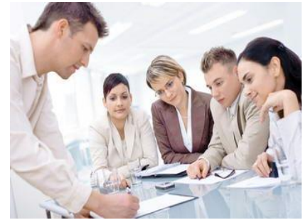
Hombres y mujeres son determinantes para la marcha de un negocio

Venta de productos Farmacéuticos y Medicina Natural, Medicina en general. Obstetricia, Enfermería, Primeros Auxilios, Inyectables, Típeos, trabajos de Cómputo y Sistemas, Traducciones, Contabilidad, Oficinas de Asesoramiento Empresarial, Consultorías variadas; Estudios Jurídicos y Contables Oficinas de Arquitectura, Diseño, Proyectos, etc.