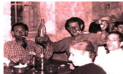
Expendir licor hasta que se emborrachen no es del agrado de Dios ni de nadie.

Asimismo, la Palabra del Señor nos advierte sobre ciertos NEGOCIOS que atentan contra la moral y las buenas costumbres: VENTA de ciertos LIBROS, REVISTAS, FOLLETOS, VIDEOS y PELÍCULAS, OBJETOS o INSTRUMENTOS PORNOGRÁFICOS y SADO-MASOQUISMO, Productos FARMACÉUTICOS DE ANTI-CONCEPCIÓN, etc.