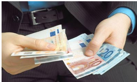
¡Ojo! Los Impuestos son para pagarse

Todo NEGOCIO, debe estar legalmente establecido. Concordado con las normas tributarias de cada país. La EVASIÓN de IMPUESTOS es condenada por la Palabra de Dios: