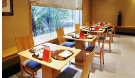
Los Restaurantes hoy son patrocinados tanto por hombres y mujeres

Los NEGOCIOS en buena parte, a su vez se orientan por géneros: