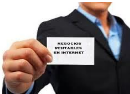
¡Cuidado! Hay muchas estafas en las Redes Sociales

“NO COMETÁIS INJUSTICIA EN LOS JUICIOS, EN MEDIDAS DE TIERRA, NI EN PESO NI EN OTRA MEDIDA. BALANZAS JUSTAS, PESAS JUSTAS Y MEDIDAS JUSTAS TENDRÉIS. YO SOY JEHOVÁ, VUESTRO DIOS, QUE OS SAQUÉ DE LA TIERRA DE EGIPTO”. (Lv.19:35-37)