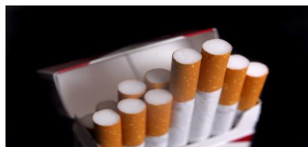
El cigarrillo, está comprobado, contamina el Sistema respiratorio y produce Cáncer

Asimismo, la Palabra del Señor nos advierte sobre ciertos NEGOCIOS que atentan contra la moral y las buenas costumbres: VENTA de ciertos LIBROS, REVISTAS, FOLLETOS, VIDEOS y PELÍCULAS, OBJETOS o INSTRUMENTOS PORNOGRÁFICOS y SADO-MASOQUISMO, Productos FARMACÉUTICOS DE ANTI-CONCEPCIÓN, etc.