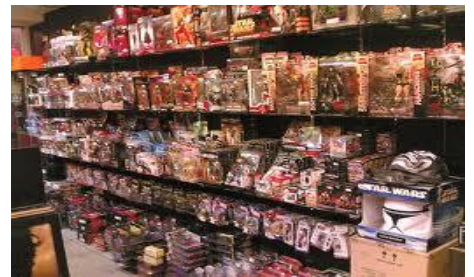
Acaparar para manipular luego con precios altos es una abominación para Dios

El ACAPARADOR, el que guarda uno o varios productos, para propiciar escasez y posteriormente ante la obligada Demanda ESPECULAR vendiendo con un precio elevado lo que guardó, es con denado en su actitud por la Palabra del Señor.