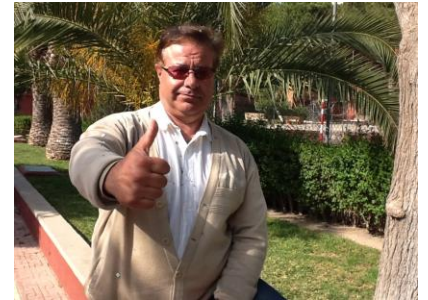
¡Yo doy a mi Iglesia, para que no falte el alimento en la Casa de Dios, y Él me prospera!

POR ESO LOS CIELOS OS HAN NEGADO LA LLUVIA, Y LA TIERRA RETUVO SUS FRUTOS. YO LLAMÉ LA SEQUÍA SOBRE ESTA TIERRA Y SOBRE LOS MONTES, SOBRE EL TRIGO, SOBRE EL VINO, SOBRE EL ACEITE, SOBRE TODO LO QUE LA TIERRA PRODUCE, SOBRE LOS HOMBRES Y SOBRE LAS BESTIAS, Y SOBRE TODO TRABAJO DE SUS MANOS”. (Hag.1:2-11)