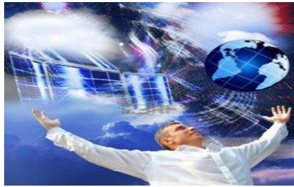
Dios Bendice al que bendice

“Manda también esto, para que sean irreprochables, porque si alguno no provee para los suyos, y mayormente para los de su casa, ha negado la Fe y es peor que un incrédulo”. (1Ti.5:7-8)