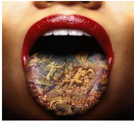
La extravagancia en TATUAJES, hoy está muy desenfrenada

También hay que tener cuidado al ASOCIARNOS riesgosamente, andando en coyundas con las tinieblas: en SOCIEDADES, CONVENIOS y CONTRATOS con personas no creyentes o de DUDOSA REPUTACIÓN y menos para FINES también DUDOSOS (¡) (2Co.6:14-18)..