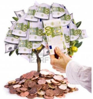
Los Bienes no depreciables

En cambio, al adquirir bienes NO DEPRECIABLES, su valor de Reventa o de Empeño sube considerablemente con el tiempo transcurrido; tal es el caso de los BIENES RAÍCES (Casas y Terrenos), METALES Y PIEDRAS PRECIOSAS, ACCIONES de la Bolsa de Valores, BONOS, DEPÓSITOS en MONEDA EXTRANJERA FUERTE, DEPÓSITOS a PLAZO FIJO Bancarios o en Financieras, en rentables NEGOCIOS o EMPRESAS, PATENTANDO, etc.