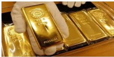
En el Oro, su reventa o empeño solo valen por su peso. La Filigrana de la joya no cuenta. Mejor comprarse un trozo o un lingote

- Si Invierte en PIEDRAS PRECIOSAS, lo más recomendable son los BRILLANTES de varios Kilates (1Kilate: 100 puntos, ½ Kilate: 50 puntos, ¼ Kilate: 25 puntos; 16 puntos, etc.). Los Puntos muestran el grado de dificultad en el trabajo artístico de joyería. Por supuesto, su Pureza es fundamental, libres de carbones, manchas o nubosidades, que desacreditan su gran valor. La pureza de un BRILLANTE es determinante.