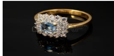
Pues en una joya, solo cuentan el peso del metal precioso y la pureza y acabado de los brillantes (Kilates) para reventa o empeño