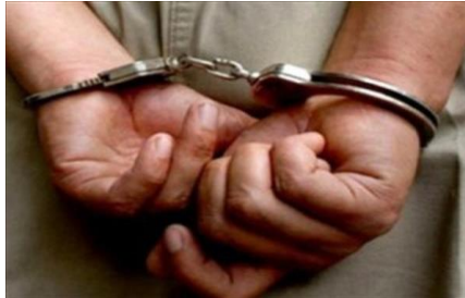
La Avaricia es una esclavitud muy difícil de escapar

PROVEEDOR, su criatura debe necesariamente RECURRIR solo a su Misericordia y Buena Voluntad para ser ASISTIDA en toda necesidad. Cualquier otra MANIOBRA de nuestra parte para obtener mayor beneficio, siempre lindará contra su Autoridad. “¡Yo Soy el Señor, Ese es mi Nombre! A ningún otro dare mi Gloria, ni a los ídolos mi Alabanza”. (Is.42:8)