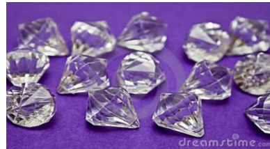
Solo adquiera Brillantes... (Las otras piedras preciosas son baratas)

La reventa o el empeño de la joya, considera EL TAMAÑO, la PUREZA y acabado artístico (PUNTOS) del BRILLANTE y el PESO del metal precioso que lo sostiene.