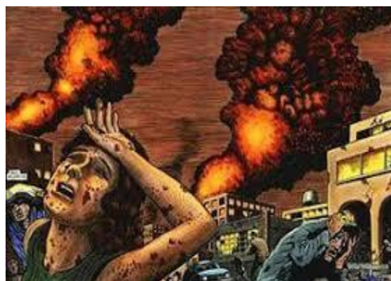
"Sobre ellos tienen como rey al ángel del abismo, cuyo nombre en hebreo es Abadón, y en griego, Apolión.

Vs.9:12 - "El primer ay pasó; pero vienen aún dos ayes después de esto".