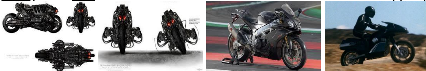
Modernas motocicletas artilladas con eficiente potencia de fuego: cohetería y misiles... ¿Algo así fueron los "caballos" que vio Juan?

"...pues el poder de los caballos estaba en sus bocas y en sus colas, porque sus colas, semejantes a serpientes, tenían cabezas y con ellas dañan". (Ap.9:19)