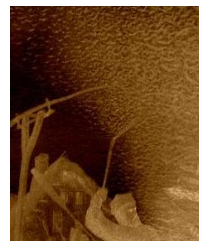
Un poderoso y radiante ángel de Luz con las llaves del Abismo, cae como una estrella a la Tierra. Ángeles caídos están prisioneros en la oscuridad del Tártaro en el Abismo del Hades o Seol. Del Abismo surgen langostas venenosas con el poder de los escorpiones para herir a la impiedad de la Tierra