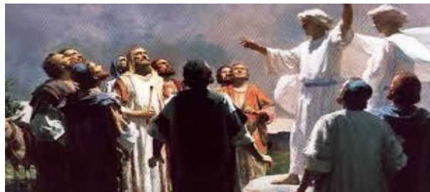
Siempre existió predicación angélica en el pueblo de Dios. La Ley fue dada por medio de ángeles (Hch.7:53; Heb.2:2). Ángeles anunciaron a los pastores en Belén el Nacimiento de Cristo (Lc.2:1-18) y a los apóstoles la II Venida del Señor (Hch.1:10-11)

4).- Y Mártires, seguirá habiendo en esos 50 días finales y en los 30 días siguientes del Derramamiento de las 7 Copas: Aquí está la perseverancia de los santos -la Iglesia fiel que está en la Tierra-, los que GUARDAN los Mandamientos de Dios y la FE de Jesús. Y oí una voz que me decía desde el Cielo: 'Escribe: Bienaventurados de aquí en adelante los muertos que mueren en el Señor -últimos Mártires-'. Sí, dice el Espíritu, descansarán de sus trabajos, porque sus obras con ellos siguen". (Ap.14:12-13)