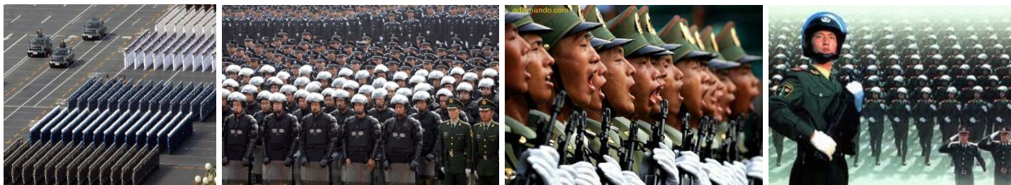
No vaya usted a suponer que son piezas inanimadas del rompecabezas "LEGO" ... No, es la disciplinada y moderna infantería de la actual China (i)

- Hay que comprender que un avión de transporte y sobretodo de carga, tipo los "Antonov" 225 soviéticos -el avión más grande del mundo- puede cargar hasta 250 toneladas, algo así como más de 3,000 soldados. Un moderno portaviones Nuclear, traslada alrededor de 5,000 hombres. Pero, movilizar 200'000,000 por su lentitud, sería toda una gran aventura expuesta al aniquilamiento, aún con los lechos secos de estos ríos. Pero, el Apocalipsis , a continuación, nos dice CÓMO es que se va a ser posible (i?):