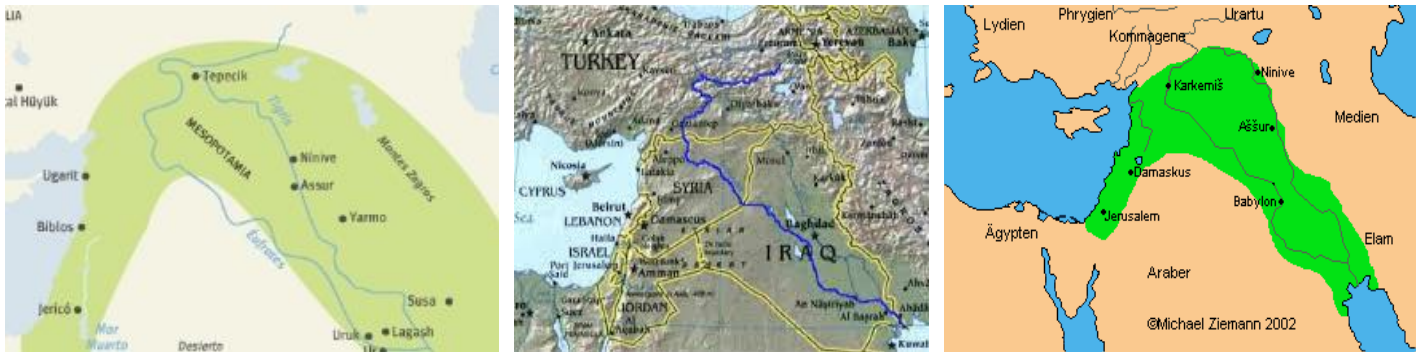
El río Éufrates y a su izquierda el Creciente Fértil que contiene la Tierra del Esplendor o la Tierra Prometida en Palestina