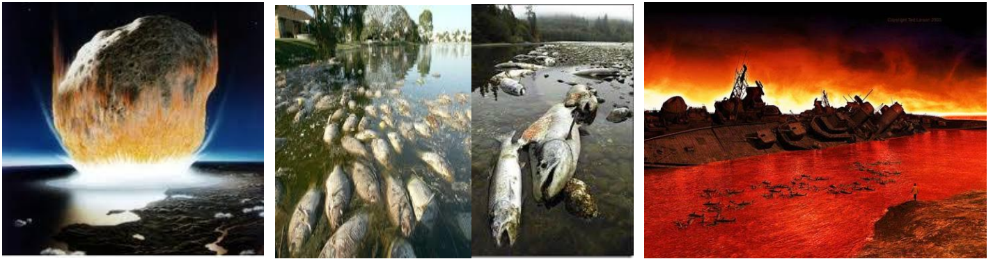
El Segundo ángel tocó la Trompeta, y algo como un gran monte ardiendo en fuego fue precipitado en el mar. La tercera parte del mar se convirtió en sangre, murió la tercera parte de los seres vivientes que estaban en el mar y la tercera parte de las naves fue destruida”.