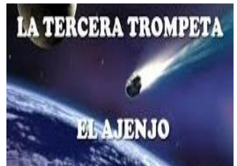
El Tercer ángel tocó la Trompeta, y cayó del Cielo una gran estrella ardiendo como una antorcha. Cayó sobre la tercera parte de los ríos y sobre las fuentes de las aguas. El nombre de la estrella es Ajenjo. La tercera parte de las aguas se convirtió en ajenjo y muchos hombres murieron a causa de esas aguas