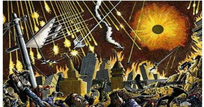
El Primer Ángel tocó la Trompeta, y hubo granizo y fuego mezclados con sangre sobre la Tierra

- Este Castigo, será con un gran destello de luces desde los Cielos, fuego consumidor en la Tierra y sus elementos destruidos: un tercio de los Bosques incendiados y los sembríos totalmente quemados ( 2Pe.3:10 ). Puesto que a partir del Diluvio Universal, Dios se comprometió con Noé, nunca más castigar al hombre con AGUAS DE DILUVIO ( Gn.8:8-11 ), estos Castigos serán abrasadores, con FUEGO exterminador, con oleadas incendiarias de un irresistible calor (i).