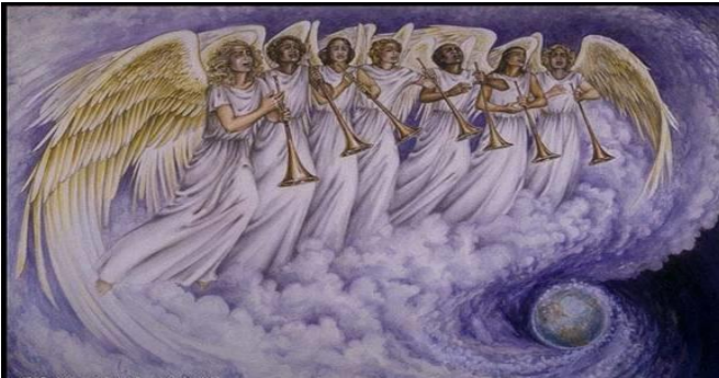
A Siete ángeles que estaban de pie ante Dios, se les dieron Siete Trompetas

Vs. 8:7 - "El Primer ángel Tocó la Trompeta, y hubo granizo y fuego mezclados con sangre que fueron lanzados sobre la Tierra. Y se quemó la tercera parte de los árboles, y toda la hierba verde fue quemada."