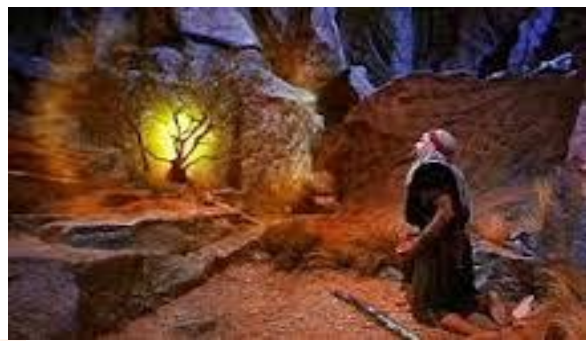
"A Dios nadie lo ha visto jamás; el unigénito Hijo, que está en el seno del Padre, Él lo ha dado a conocer" (Jn.1:18)