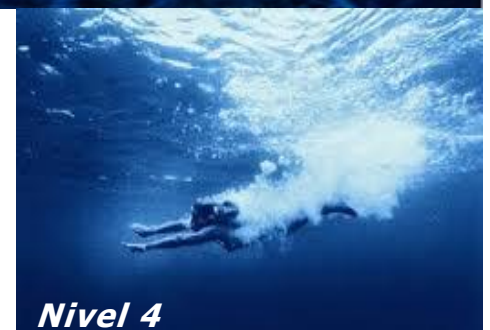
El Gran Río de Dios que brota desde su Santuario Celestial y Trono, y los cuatro Niveles de la Unción del Espíritu (Ez.47)