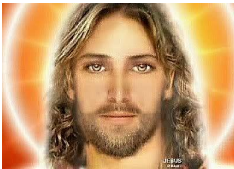
"Felipe? El que me ha visto a mí, ha visto al Padre; ¿cómo dices tú: 'Muéstranos al Padre?' (Jn.14:9)

- Dios el autor de la LUZ , es LUZ y resplandeceremos bajo su Presencia por toda la Eternidad. No habrá más noche.