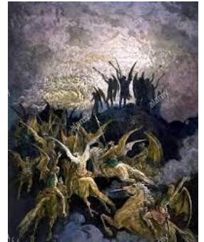
El Juicio Final de los "muertos pequeños": LOS HOMBRES y los "muertos grandes": LOS ÁNGELES CAÍDOS (Ap.20:12). Ver también Jud.6; 2Pe.2:4

Vs.20:14 - "La muerte y el Hades fueron lanzados al Lago de Fuego. Esta es la muerte segunda.