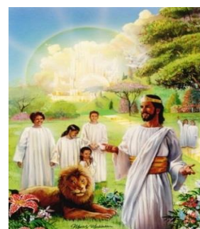
En el Milenio, león y cordero pacerán juntos (Is.11:6-16, 65:17-25). El único Rey será el S. Jesús

- El Señor ha manifestado desde siempre en su Palabra y a través de sus profetas este Advenimiento de su Gobierno terreno entre los hombres y a partir de su Segunda Venida; que será por MIL AÑOS y conocido como EL DÍA DEL SEÑOR. "Acontecerá en los postreros tiempos que el Monte de la Casa de Jehová será colocado a la cabeza de los montes, más alto que los collados, y acudirán a Él los pueblos. Vendrán muchas naciones, y dirán: "Venid, subamos al Monte de Jehová, a la Casa del Dios de Jacob; Él nos enseñará en sus caminos y andaremos por sus veredas", porque de Sión saldrá la Ley, y de Jerusalén la Palabra de Jehová. Él juzgará entre muchos pueblos y corregirá a naciones poderosas y lejanas. Ellos convertirán sus espadas en azadones y sus lanzas en hoces. Ninguna nación alzaré la espada contra otra nación ni se preparará más para la guerra. Se sentará cada uno debajo de su vid y debajo de su higuera, y no habrá quien les infunda temor. ¡La Boca de Jehová de los Ejércitos ha hablado!". (Miq.4:1-4)