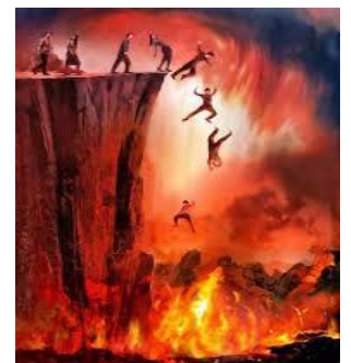
Satanás, sus demonios, los ángeles caídos y los hombres impíos serán lanzados al Lago de Fuego y Azufre o INFIERNO