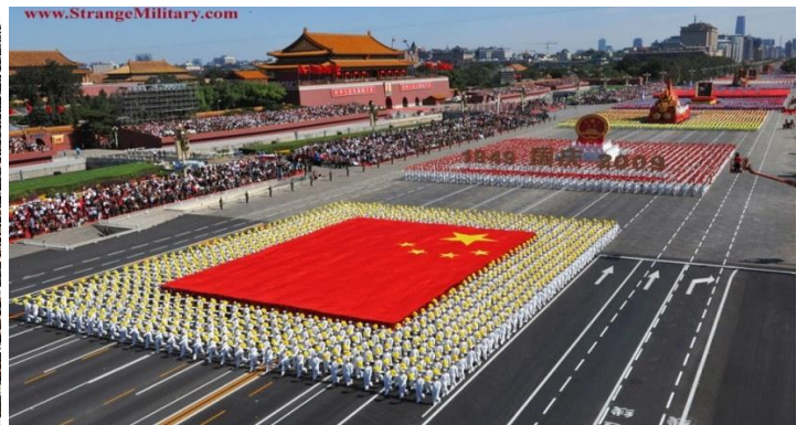
Solo la República Popular CHINA asegura que tiene un ejército de 200 millones de soldados (i). Los Batallones de su Infantería tienen 24 soldados por línea y 24 por cada columna... los nuestros, modestamente, solo 9x9 soldados (i)

Ya estudiamos como al tocarse la 6ta.Trompeta , días antes del asesinato de los 2 Olivos , se dio la autorización de que fuese secado el lecho del gran río Éufrates –que separa el Medio Oriente del Asia Continental-, y es precisamente al derramarse la 6ta. Copa , en estos 30 días finales, que se hará efectiva su aplicación: Los reyes del Oriente (de la gran Asia