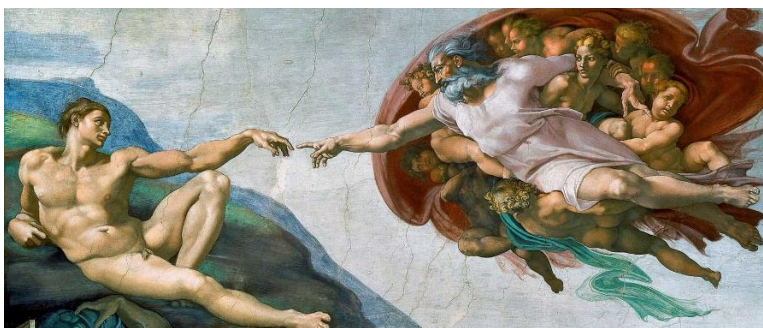
El Misterio de Dios consumado: la recuperación del Hombre Glorificado (i)

"Y les dijo: -A vosotros os es dado saber el MISTERIO del REINO de Dios; pero a los que están fuera, por parábolas todas las cosas, para que, viendo, vean y no perciban; y oyendo, oigan y no entiendan" . (Mr.4:11-12)