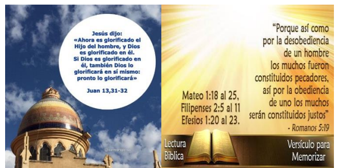
Jesucristo, el Primogénito Glorificado de otros hombres de FE

3.- La Voz proveniente del Cielo, habló nuevamente al apóstol Juan, ordenándole finalmente, que tomara el Rollito o Libro abierto de la mano del Ángel Fuerte ; y el Ángel, le ordenó que lo comiera. Tan igual a como ocurrió con el profeta Ezequiel (Ez.2:8-10,3:1-3) o conforme al sentir del profeta Jeremías (Jer.15:16); le fue dulce como la miel en su boca, pero le amargó el vientre. Y seguidamente, se le ordenó siguiera profetizando a todos los hombres y naciones.