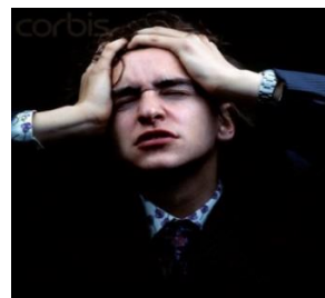
...otras muy deprimentes