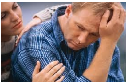
Hay personas increíblemente amargadas

"Sepulcro abierto es su garganta; con su lengua engañan. Veneno de áspides hay debajo de sus labios; su boca está llena de maldición y de AMARGURA. Sus pies se apresuran para derramar sangre; quebranto y desventura hay en sus caminos; y no conocieron caminos de PAZ. No hay temor de Dios delante de sus ojos". (Ro.3:14)