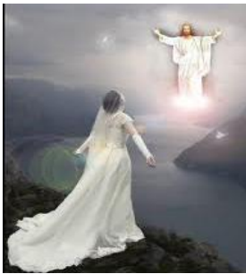
La relación que debemos tener con el Señor, es de Novia, no de hijos o siervos

- Diciéndole solo "Te amo" repetidas veces. Porque cuando hay dos personas enamoradas, el silencio basta, las miradas son suficientes. Esos BESOS son de intimidad plena, de entrega, de una relación muy estrecha, de sinceridad y de unidad, de amor. No son de ninguna manera como los Besos de María Magdalena al besar sus pies, besos de arrepentimiento, al haber estado sucia, descalificada e insignificante y ahora ya estar liberada ( Lc.7:38-45 ) o como los besos del Padre a su hijo pródigo en su solicitud de perdón ( Lc.7:15:20 ).