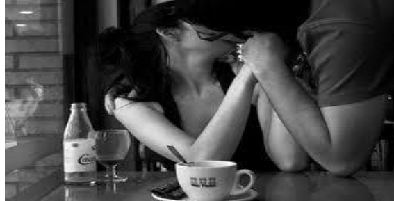
Un Beso de saludo siempre será una señal de cariño...