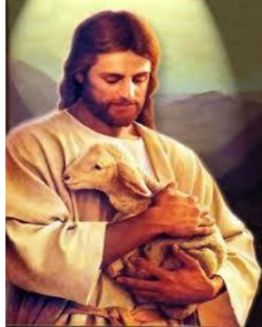
Las Caricias de Cristo son con Amor eterno y especialmente con los corderos