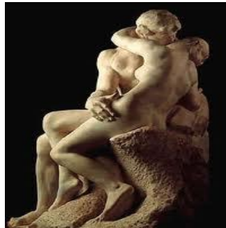
"El Beso", famosa escultura del francés Auguste Rodin (1840-1917)