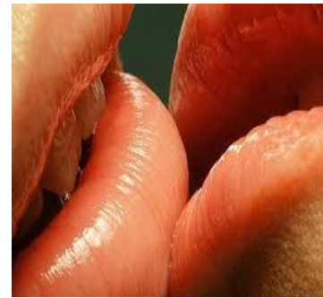
El Beso, es lo que siempre queremos saber pero que nadie sabe explicar

- Cuando BESAMOS a alguien, es que nos estamos colocando extremadamente cerca de una persona, entrando a su área privada, personal, sentimental y emocional. Nuestros sentidos corporales cual antenas nos denuncian olores, fragancias, lozanía de piel; la aceptación plena, mediatizada o el rechazo de la otra parte, y todo ello nos provee una serie de pistas sobre cuán compatibles somos o no con la otra persona. Es por esto que la Palabra nos advierte claramente que los saludos entre los fieles tienen que ser con ÓSCULO SANTO, CASTO (1Pe.5:14; 2Co.13:2) pues, NO debe haber ningún tipo de CODICIA SEXUAL en el contacto con la otra persona porque ADULTERAMOS en nuestro corazón (Mt.5:28).