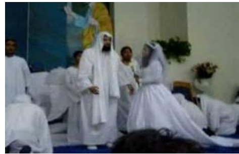
Tenemos que entrar a la recámara del rey, a sus habitaciones, para esperarlo

- Lamentablemente, hay creyentes que no tienen una relación de "NOVIA" comprometida con el Señor, sino que tienen una vinculación de SIERVOS, que solo esperan su Paga, el de ser siempre Bendecidos. Otros se conforman con una relación de HIJOS y disfrutan desde ahora su Herencia, y sin proponérselo siquiera empiezan a perder su intimidad con el Señor, al deleitarse receptivamente con solo sus beneficios. La tan anunciada y próxima APOSTASÍA está a su puerta, pues no saben cómo retornar. ENTRAR A LA CÁMARAS DEL REY ES NUESTRO DESAFÍO: