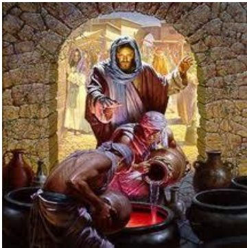
También habrá Vino Nuevo en las Bodas del Cordero y su Iglesia

- Esa, de ninguna manera es la Amada del S. Jesucristo (i?).