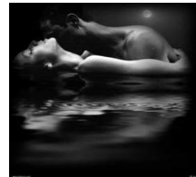
Contemplar toda desnudez excita, cuánto más si nos tocamos. Aunque no nos toquemos, el amor no disminuye. Toda pasión tiene un comienzo