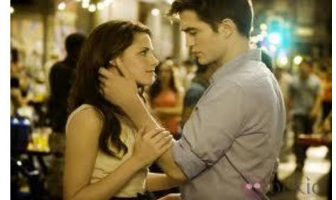
Una Caricia también, pero a solas, es peligroso