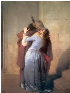
"El Beso", famoso cuadro del veneciano Francesco Hayez (1791-1882)

- Los animales también se BESAN y sus besos podrían tener el mismo origen que el de los humanos, aunque se desconoce las leyes del instinto y lo que ellos experimenten al besar. Probablemente se estén conectando en una forma similar a como nosotros lo hacemos afectivamente o también eróticamente, reforzando lazos; obedeciendo rangos o jerarquía ambiental o también, simplemente, por puro acicalamiento.