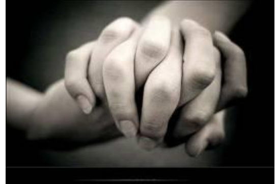
"Los sanos no tienen necesidad de médico sino los enfermos. No he venido a llamar a justos sino a pecadores" (Mc.2:17)