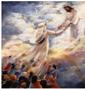
Porque Él nos ama con un amor inefable, como a la niña de sus ojos