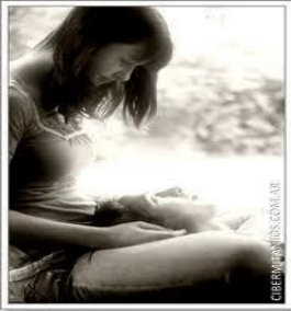
Evitemos lugares aislados