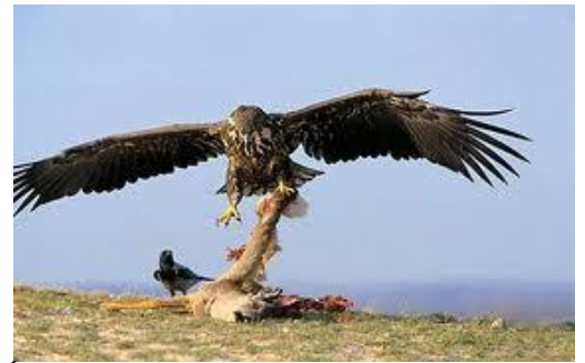
Águila diezmando a su presa. La destroza con sus garras