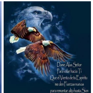
El ojo del Águila – Una espectacular Visión única y muy especial. Mucho tenemos que aprender del Águila