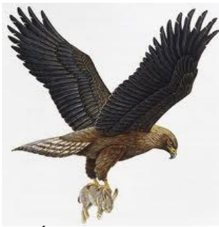
Águila transportando su presa

- El ÁGUILA puede levantar hasta 4 veces su peso (40 kilos), se trata de un animal muy fuerte. Como creyentes también estamos llamados a ser "espiritualmente muy fuertes". 2Ti.4:17 nos dice: "El Señor estuvo a mi lado y me dio FUERZAS, para que por mí fuera cumplida la Predicación, y que todos los gentiles oyeran. Así fui librado de la boca del león".