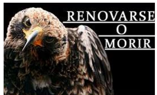
El diseño frontal inspirado y por su majestuosidad del águila le permite utiliza un 25% más de Energía eficiente.