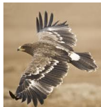
la fragilidad de su vuelo

5.- Las aves de corral nacieron para estar en un corral, el ÁGUILA nació para estar LIBRE. Nuestra naturaleza espiritual es de GOZAR UNA PLENA LIBERTAD EN JESUCRISTO. SOMOS LIBRES EN CRISTO (Jn.3:7-8; 2Co.3:17).