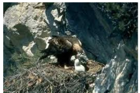
Águila Real alimentando a su polluelo