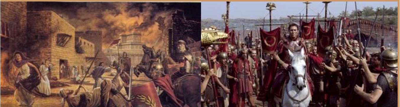
El Imperio romano, se ha constituido en un flagelo de Israel; y cuenta con la representatividad del ÁGUILA en sus construcciones, emblemas y estandartes

- Casi 19 SIGLOS ha durado este Cautiverio del pueblo judío, dispersados por todo el planeta (70 d.C. a 1948).