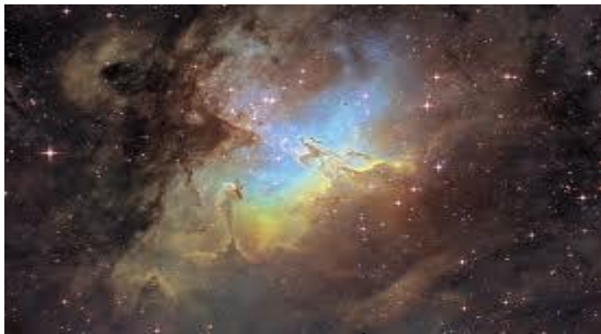
La Nebulosa del Águila