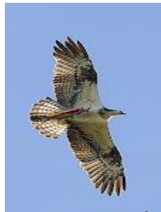
El Águila vive en América del sur hasta Río Negro