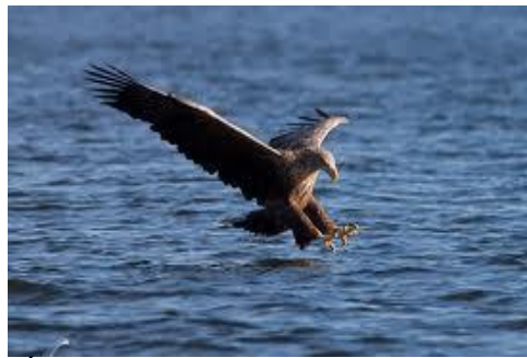
Águila marina de cola blanca capturando un pez