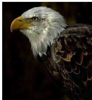
Águila Calva de U.S.A.