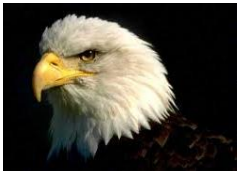
El Águila pueden fijar sus penetrantes ojos en el Sol sin siquiera parpadear

"Aunque la higuera no florezca, ni en las vides haya frutos, aunque falte el producto del olivo, y los labrados no den mantenimiento, aunque las ovejas sean quitadas de la majada, y no haya vacas en los corrales; con todo, yo me alegraré en Jehová, me gozaré en el Dios de mi Salvación. Jehová el Señor es mi fortaleza, el cual hace mis pies como de ciervas, y me hace caminar por las ALTURAS " .