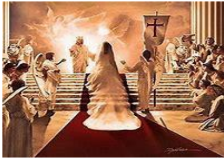
Las Bodas del Cordeiro y su Iglesia

11). - Se celebrarán las Bodas del Cordeiro con la Iglesia Fiel Glorificada a la casi finalización del Derramamiento de la 7ma y última Copa en esos 30 días adicionales de la Consumación del Castigo de Dios y una vez destruida la Gran Babilonia ( Ap. 19:4-9 ).