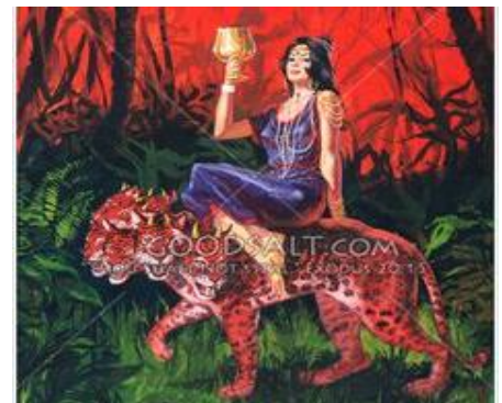
La Gran Babilonia

9).- Terminará el accionar del poderoso espíritu de la Corrupción en la Tierra: la Gran Babilonia (Ap.17, 18 y 19:1-2) y se iniciará la purificación del pecado y de la inmundicia espiritual en Israel y en todo el mundo, y conforme se hizo con la Redención de la Iglesia en estos 2,000 años. Y así también se dará Fin a la Prevaricación, al Pecado y se expiará la iniquidad, (Dn.9:24; Zac.13).