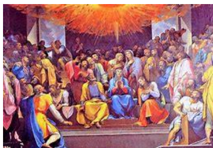
Pentecostés: la Fundación de la Iglesia

- Para estos discípulos, los « postreros tiempos » no estaban a 2,000 años de tiempo, sino que comenzaban recién a partir de la Resurrección de Cristo y 50 días después ( Lev.23:12-16 ), en el año 30 d.C. en Pentecostés, con la Iglesia.